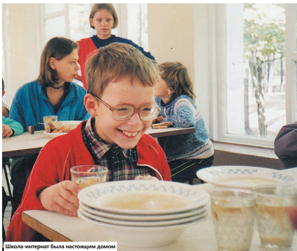
Школа-интернат была настоящим домом